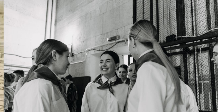
Коллектив занял 3 место в «Городской Студенческой Весне 2023»